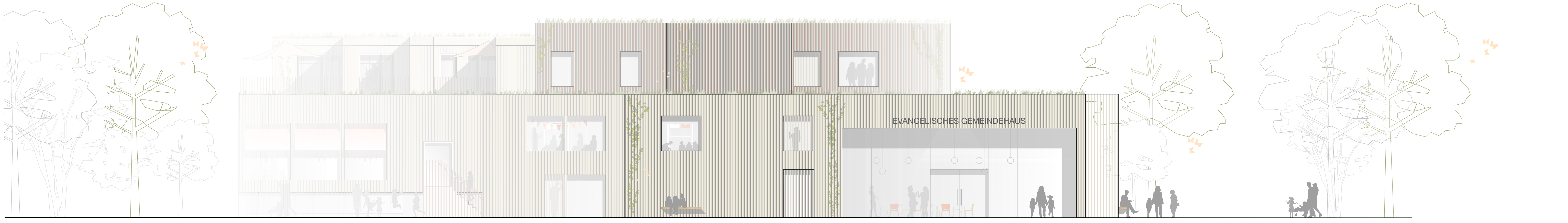
Ansicht Süd M 1 | 100

Für die Jugend entsteht ein separat zugänglicher Bereich über dem Gemeindesaal. Die zur Alten Allee ausgerichtete Dachterrasse sorgt für ausreichend Abstand zur Nachbarbebauung und minimiert so mögliche Lärmbelastigungen. Das Gebäude fügt sich somit rücksichtsvoll in seine Umgebung ein.