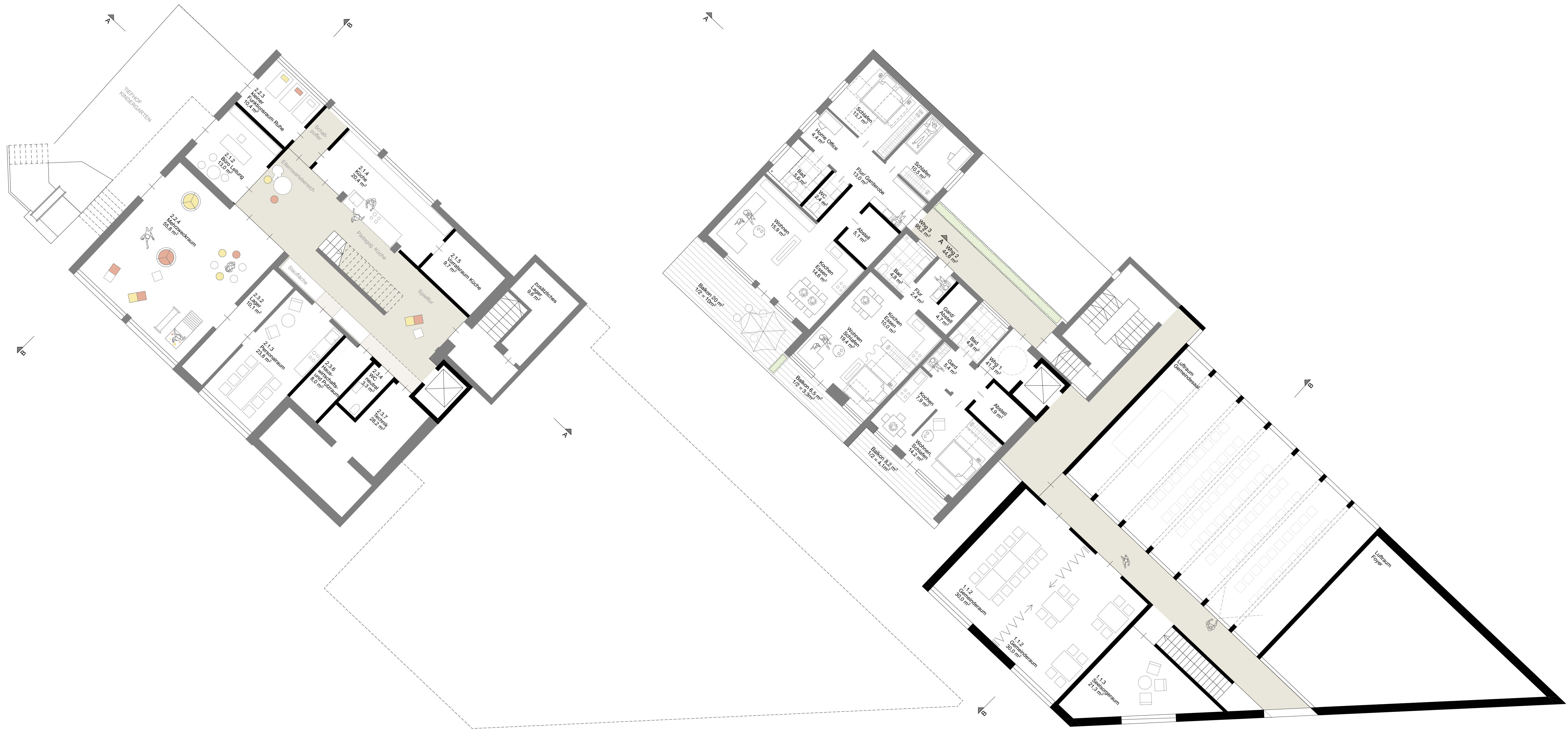
Grundriss Untergeschoss M 1 | 100